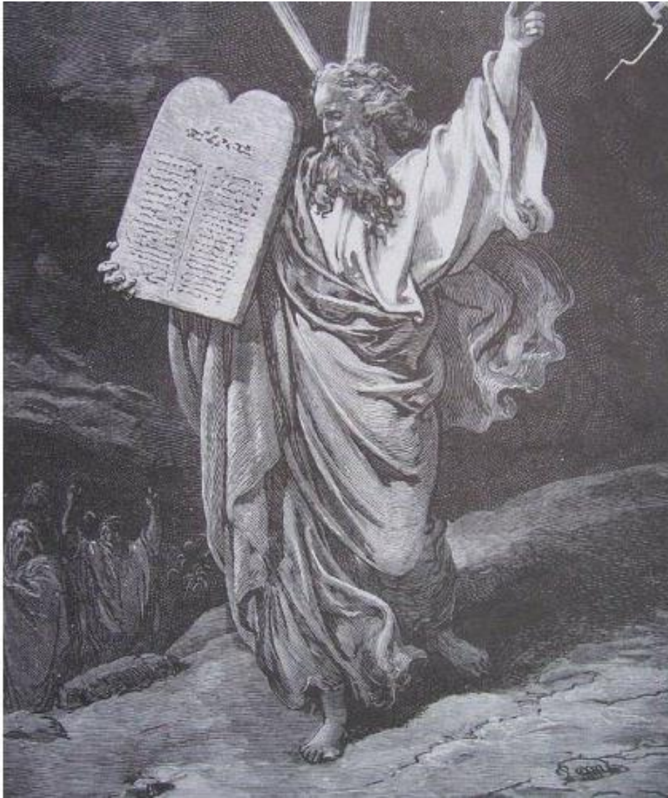
Le peuple reçoit les 10 commandements