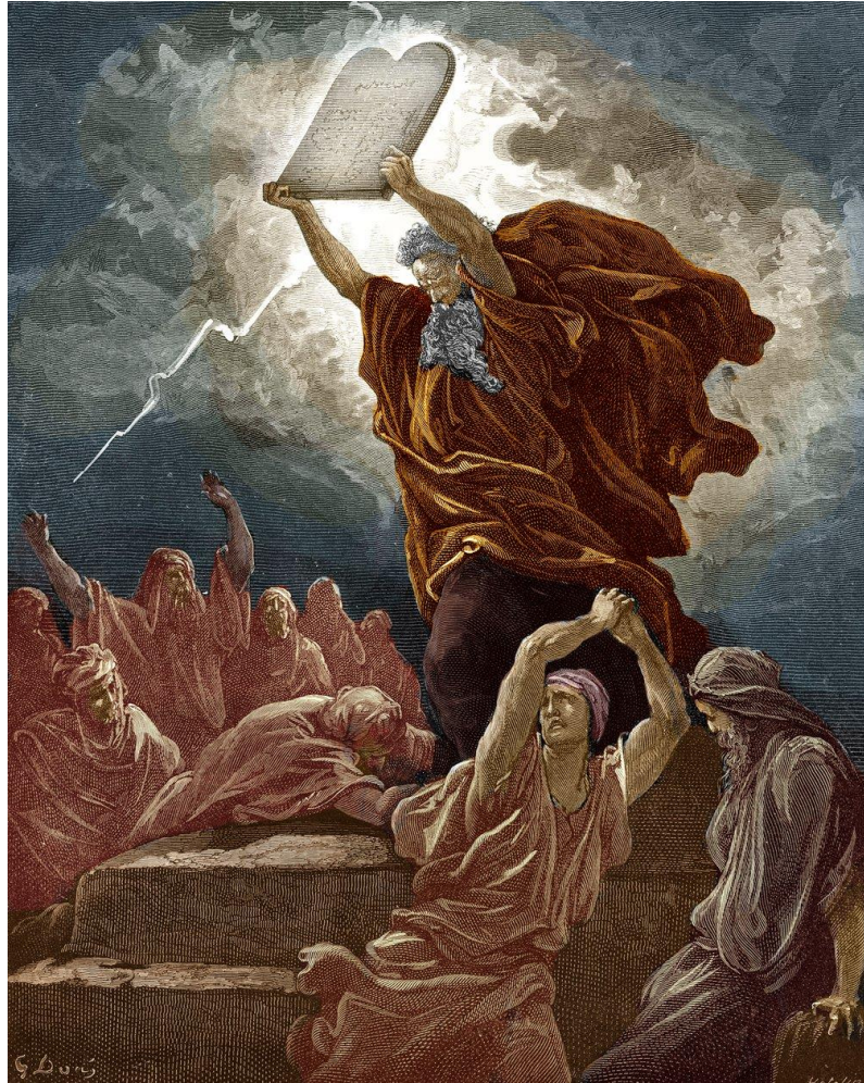
Les tables (ré) écrites par Moïse.